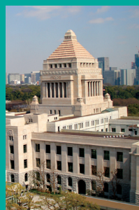
■事務所から見た国会議事堂