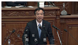
H25.11.19 ついに本会議・討論デビュー 与党代表としての討論に、野党も唸った

皆さまの温かいご支援を賜り、一年間元気づけ無事故で地域と現場を走り抜くことができました。2014年も皆さまの声の代弁者として、目の前の一人を大切に全力で働いて参ります。