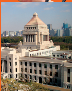
■事務所から見た国会議事堂